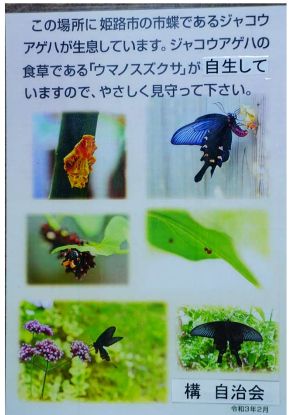
こんな感じで蝶が舞っています。