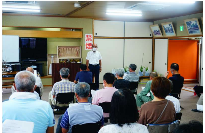
お世話をされている老人クラブの方が説明してくださいました。