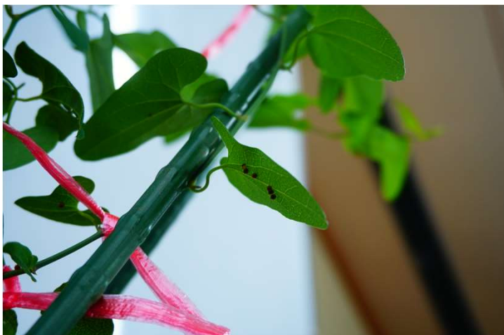
葉の裏についている卵